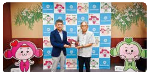
金岩地区コミュニティ協議会様

金岩地区コミュニティ協議会より、令和5年8月5日（土）に開催されました「金岩夏まつり」にて、地域のみなさまより赤い羽根共同募金にご寄附がありました。この募金は、地域福祉活動に活用させていただきます。