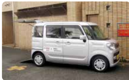
あまのかけあしS (移動援助サービス事業)