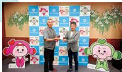
今善トラクター様

セブンイレブン七宝町桂店 …………… 7,566円 ファミリーマート美和高校前店 …………… 449円