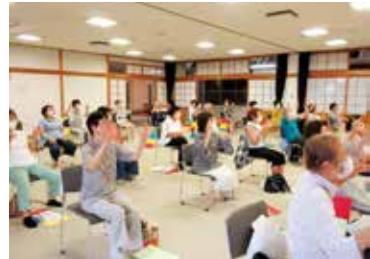
七宝地区宝寿会連合会女性部

出前講座では体操に簡単な質問を交えながら、みなさんに楽しく学んでいただける内容となっております。講座の内容等は気軽にご相談ください。