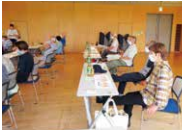
七宝地区宝寿会連合会友愛チーム七宝

「フレイル予防・運動強度について」「今日からできる低栄養予防」と題して福祉出前講座を開催しました。