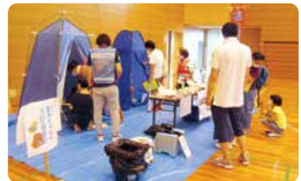
親子防災体験事業

その他、ボランティア団体への補助金交付、車いす専用車の貸出、心身障がい児・者クリスマス会、福祉人材育成事業（介護職員初任者研修）などを実施しています。