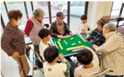
ふれあい・いきいきサロン支援事業