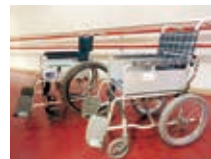
※車いすは介助式(右)・自走(自操)式(左)があります。