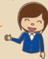
[[C-1] 豊 (C-1) 豊 : 豊]

脳トレーニングは、考えたり記憶する作業を伴うことで脳の血流が増加し認知機能の改善につながります