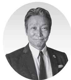
あま市社会福祉協議会 会長