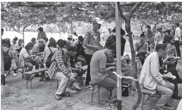
※この事業は赤い羽根共同募金配分金で行われています。

平成29年9月24日(日)、市内の心身障がい児・者を対象にバスハイクを開催し172名の参加がありました。トヨタ博物館(長久手市)では世界の自動車や日本の旧車から電気自動車まで様々展示してあり、車の歴史を学びながら昔を思い出されていました。八丁味噌の郷(岡崎市)では味噌作りの説明を受けながら、八丁味噌の熟成蔵の中を通りぬける貴重な体験をすることができました。駒立のぶどう園はあまくておいしいぶどうをたくさん食べることができ、皆様たのしい1日を過ごされていました。