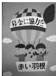
美和中 2年 木村 真夕