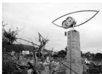
津波が到達した時間で止まった時計 (15時25分)