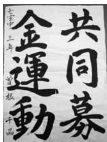
七宝中 3年 曾根 千晶