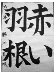
美和東小 6年 勝川 美咲