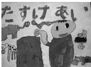
伊福小 2年 山下真次郎