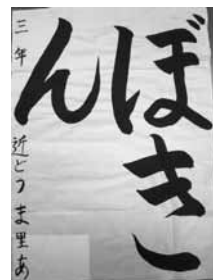
甚目寺東小 3年 近藤 麻里杏