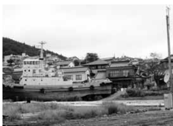
住宅の前に停まったままの船

被災状況としては、津波が来たところと来なかったところの被害が一目瞭然でした。大船渡市は地震での家屋の倒壊はなく、全て津波での被害でした。現在も住宅の前に船が動かせないままであったり、小学校の運動場が全てがれきの山になっていたり、津波で駅がなくなり電車が通ってない状態など、震災から5ヶ月後の現地でしたが、壊滅的な情景がいたるところに残っていました。今後も長期的な支援が必要だと実感しました。また、あま市で災害が起きた際の備えとして、この経験を活かしていきたいと思います。