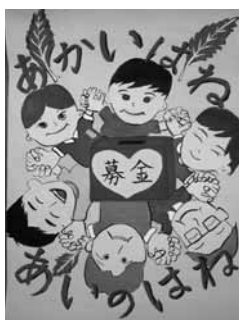
正則小 6年 須崎 智也