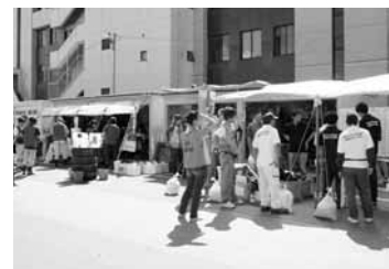
運転手との配車調整