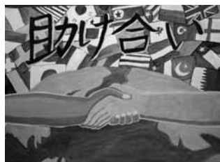
甚目寺小 6年 櫻井 一葉