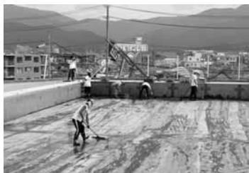
小学校のプール清掃