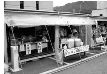
ボランティアセンター受付

私の担当は、「ボランティア送迎」部門の配車係になり、活動先が決まったボランティアを送迎するための運転手と車を決め、活動で必要となる資材を調整し、ボランティアを誘導する係になりました。ボランティアが気持ちよく活動ができるように職員全員、笑顔で元気に送り出しや迎え入れを行うように心がけて活動をしました。