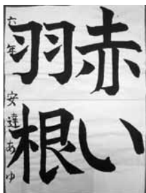
美和小 6年 安達 あゆ