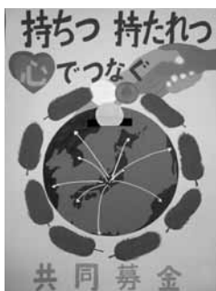
七宝北中 3年 近藤 綾香