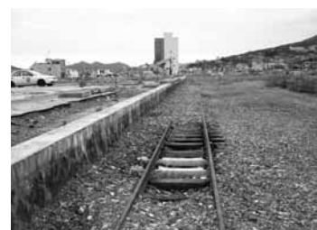
大船渡駅のホーム