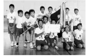
【七宝地区】 ナマズライトニング