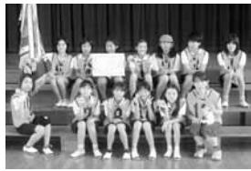
【美和地区】 中橋・蜂須賀第1・第2