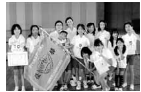
【七宝地区】 伊福スクロース