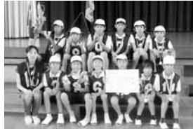
【美和地区】 寺町第1・第2・宮町