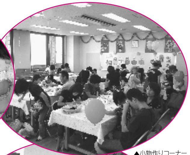
▲小物作りコーナー