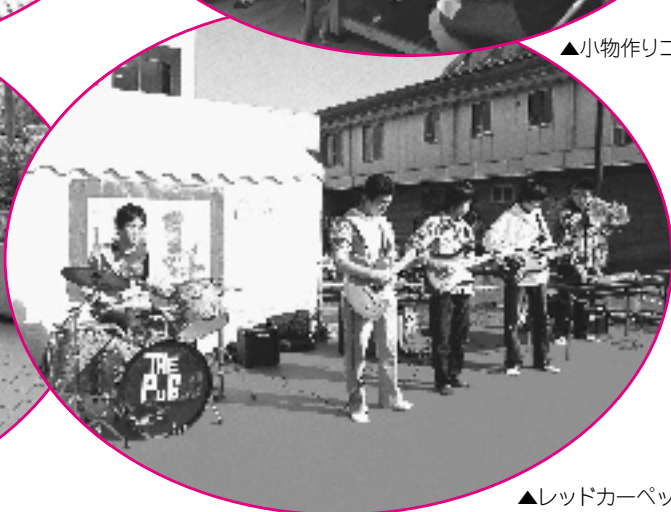
▲レッドカーペット