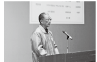
〈沖之島地区コミュニティ推進協議会〉