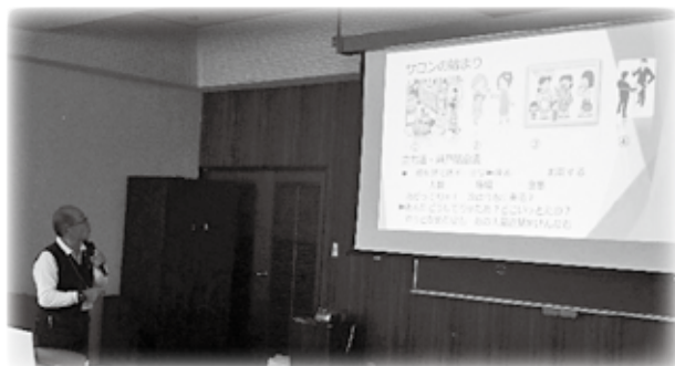
あま市内(中橋地区と桂地区)と市外のサロンの事例紹介を行いました。