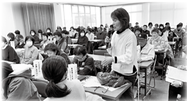
「サロンを三世代の繋ぎの場にしたい」「ガーデニング講座をやりたい」「地域の人を巻き込みたい」など、いろいろな考えや思いを発表しました。

何のためにサロンが作られたのか、サロンに訪れる皆さんからいただいた意見をもとに、今のサロンの姿をみつめる時間となりました。