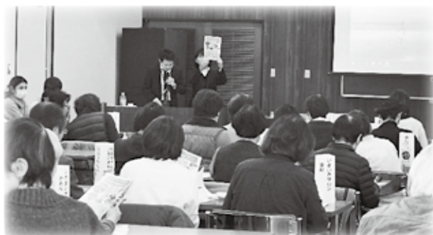
生活支援コーディネーターより「地域で支えあい」についてお話をいただきました。