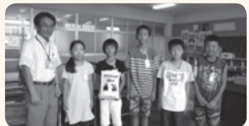
あま市立七宝小学校