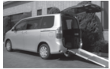
▲車いす仕様車スロープタイプ(ノア) 乗車人数:5名+車いす利用者1名